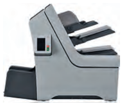
STANDARD 2 bacs multiformats + Option lecture OMR/BCR + 1 bac courrier quotidien