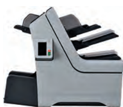
PRO 1 bac multiformats + 1 bac encart + Option lecture OMR/BCR + 1 bac courrier quotidien