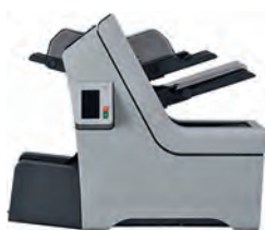
STARTER 1 bac multiformats + 1 bac encart + Option lecture OMR/BCR + 1 bac courrier quotidien