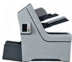
PREMIER 1 bac multiformats + Option lecture OMR/BCR + 1 bac courrier quotidien